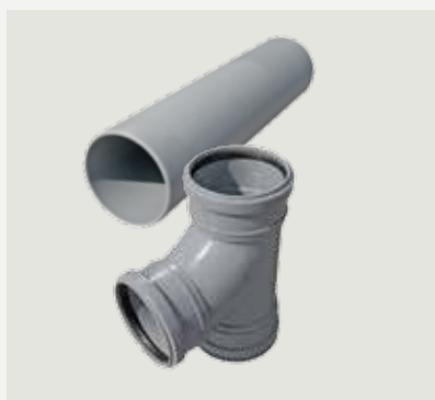
Anslutningsrör frånluft, 45 cm och T-rör