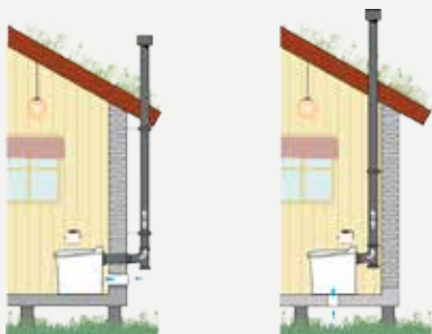
Installation av Cinderella Classic och Gas