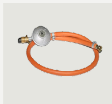
Gasslang och regulator