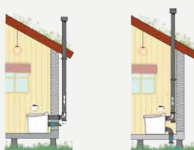
Installation av Cinderella Comfort