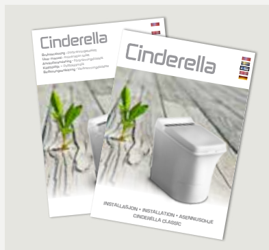
Installations- och användaranvisning