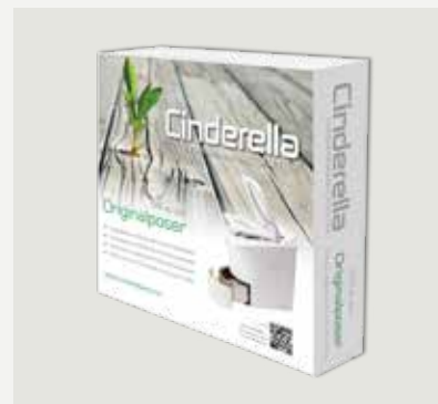
500 st papperspåsar